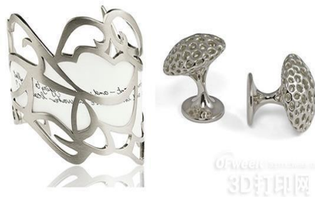
3D 打印的铂金属饰品

直接 3D 打印贵金属的优势，在于可以完成非常复杂的几何形状，实现不能通过传统技术制作的首饰的制作，因此，虽然目前直接 3D 打印贵金属尚存在以上问题，虽然该方法的市场占有率不高，但对于日趋成熟的个性化市场，直接 3D 打印贵金属仍具有很大的潜力前景。